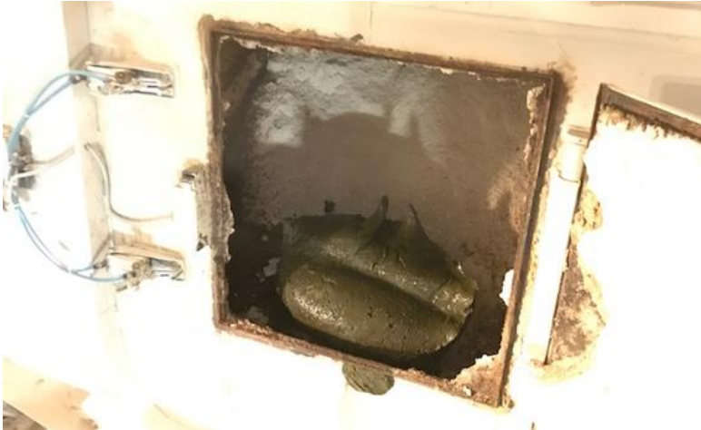
Figur 4: Tilsat græsproteinpasta klar til opblanding.