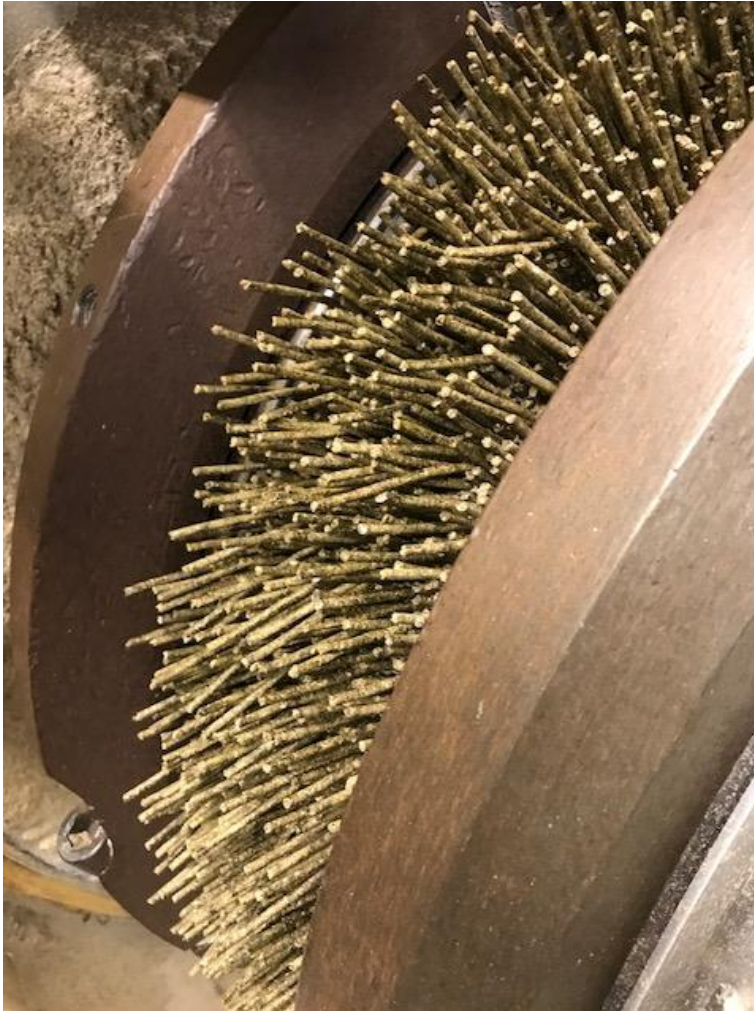
Figur 7: Foderpiller med græsprotein kommer ud af pillepressen.

Efter opblanding i kaskadeblanderen blev foder materialet tilsat vanddamp, der hævede temperaturen til 60 grader, hvorefter foderet gik ind i pillepressen, hvor temperaturen på grund af trykket når op på 82 grader som krævet af hensyn til hygiejnisering (jf. salmonella-handlingsplanen) (fig. 7). Derefter køles pillerne og er klar til levering.