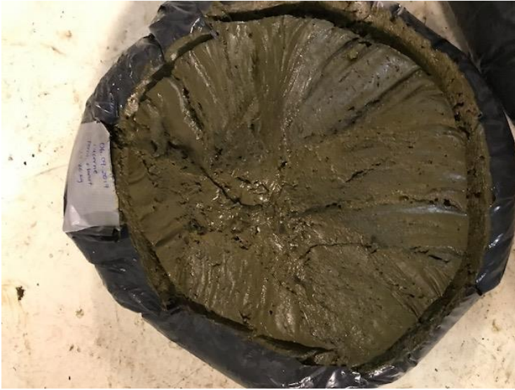
Figur 1: Græsprotein-pasta klar til tilsætning i foderblandere.