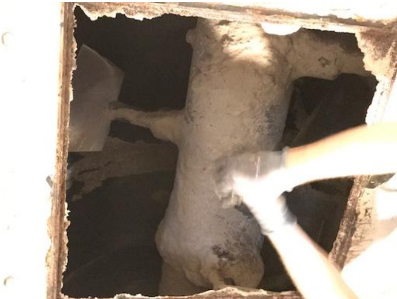
Figur 5: Kaskadeblander indarbejder græsproteinpastaen.