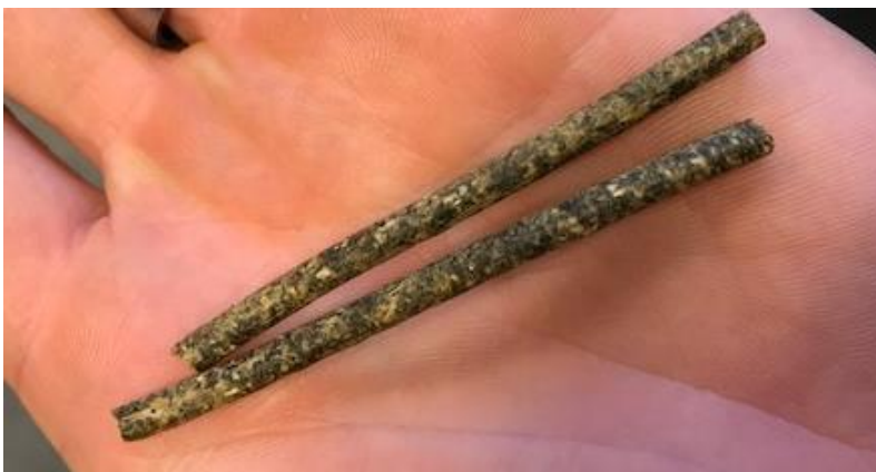
Figur 6: Foderpiller med græsprotein, der ses som mørke pletter.