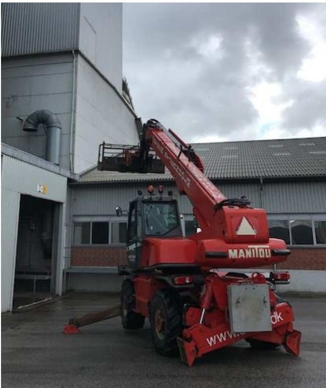
Figur 2: Teleskoplæsser klar til at løfte sække med græsprotein op til lugen øverst i billedet.

Pastaen blev tilsat til et af anlæggets kaskadeblandere, der er placeret i 3. etages højde, hvorfor sækkene med proteinpasta måtte løftes op med en lejet teleskoplæsser (fig 2).